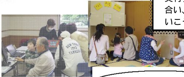
体験ルーム & 軽食

来場者の方にアンケートを行ったところ、「有意義な活動をしていてすばらしい」「参加型が多くて楽しかった」や、「来年もまた来ます!」といった感想を多数いただきました。これも、7回と回数を重ね、実行委員会である団体間の連携が出来ていたこと、東京経済大学生の参加など、新しい試みをした結果であったと思います。来場者の声を励みに、実行委員会では第8回に向けての課題などを話し合い、より盛り上がる楽しいフェスティバルにしていこうと意気込み十分です。