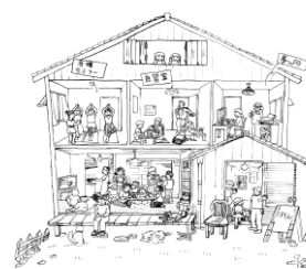
みんなのいえ イメージ