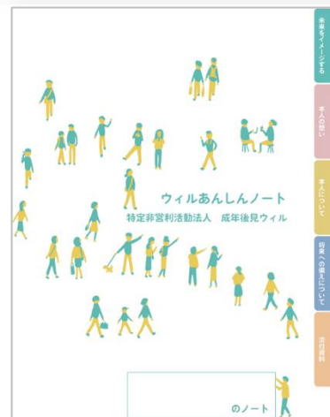
↑ウィルあんしんノート表紙